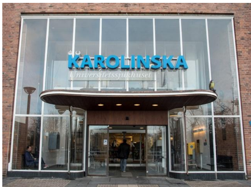
Fig. 8. KS:s huvudentré 2015.