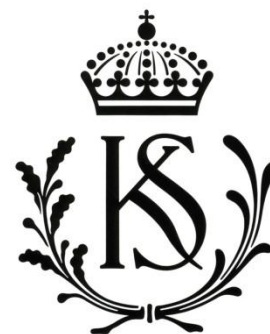
Fig. 3. Svart-vit version av KS:s emblem i 1991 års grafiska profilprogram

de underliggande symbolerna i form av sammanflätade kvistar av ek- och lagerblad (Fig. 3). För att förstå att det rör sig om ett sjukhus måste man dock veta vad bokstäverna K respektive S stod för. De flesta gjorde nog det men