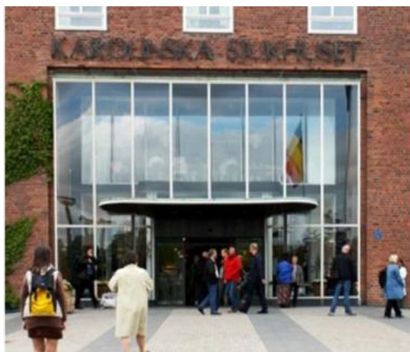
Kopparskylten över Karolinska sjukhusets entré, som det såg ut förr

Motståndet var länge massivt. Men till slut gav dock byggnadskommittén med sig: skylten gjordes i koppar och blir allt vackrare. Man får bara hoppas att man nu inte klämmer in det nya tillägget "UNIVERSITETS" där också.