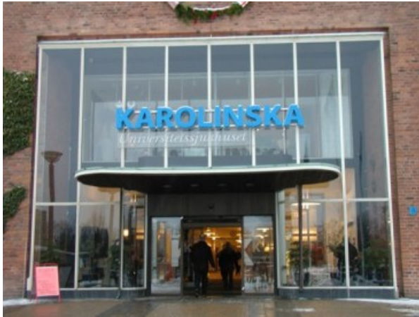
Skylden över KAROLINSKA universitetssjukhus huvudentré, som den ser ut idag.