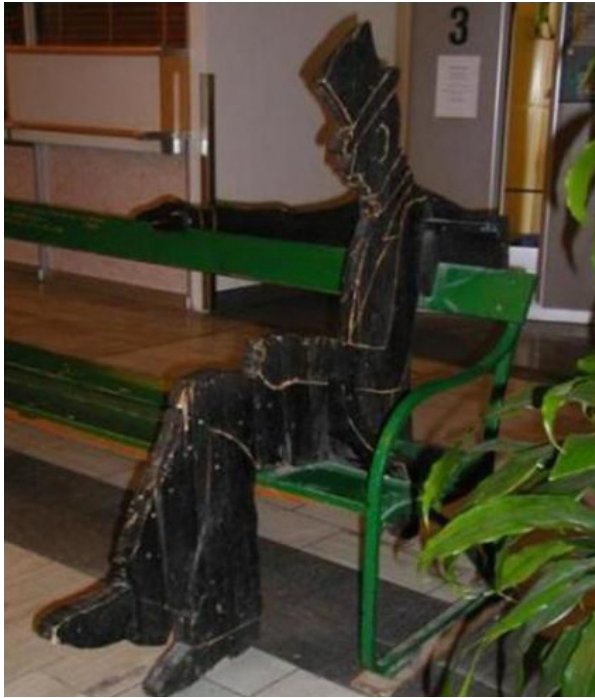
BILD av prototypen till K G Bejemarks Ferlinskulptur i Karolinskas entré