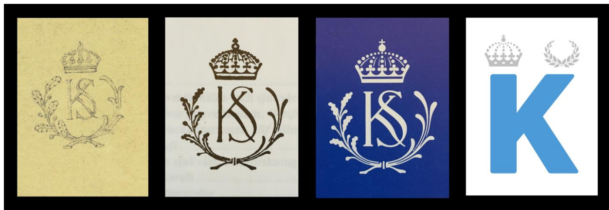
Fig. 3. KS:s märke genom tiderna. Längst till vänster det ursprungliga förslag som förordades av sjukhuset, (se även Fig. 1 och 2). Därefter följer den renritade versionen av detta förslag som kom att användas fram till december 1991 och sedan den uppsnyggade version som ingick i 1991 års grafiska profilprogram. Längst till höger visas dagens märke som infördes år 2006.

I Fig. 3 visas slutligen den utveckling som KS:s emblem genomgått från 1937 till dags dato.